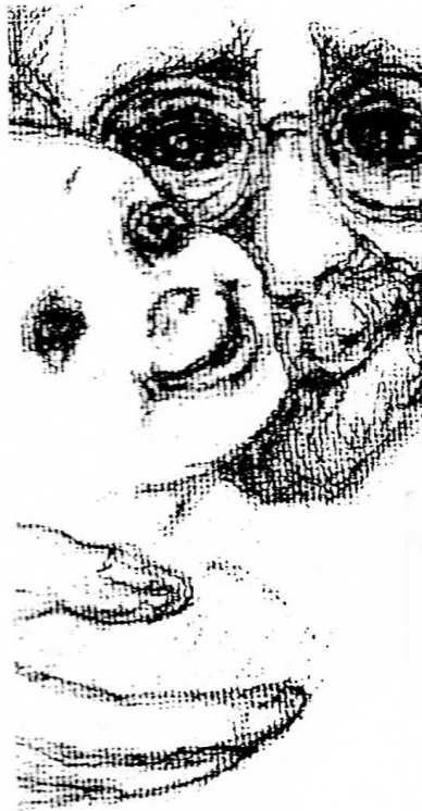
Illustration von Itzhak Belfer, Maler des Holocaust